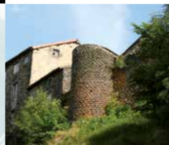
Le vestige de la Tour de Camio ou de Chabrelhat rappelle que ces hautes murailles qu'elle flanque étaient autrefois des fortifications.

Le rempart du Muret , le plus long depuis la porte des Roches jusqu'à celle du même nom, fermait la Ville sur le nord-est du plateau. En arrivant depuis la Planèze, on pénétrait ainsi dans la cité par la porte du Muret, protégée par deux barrières, une avant-porte couverte d'un toit et consolidée par deux tours et par une porte fortifiée. Aujourd'hui, il ne reste rien de ce vaste édifice. Remarquons, en contrebas du rempart et délimitant des jardins, des murets en pierre qui ont été bâtis, dès le XVII e siècle, au moment où, le pays ne connaissant plus d'invasion, la paix semblait assurée. Les habitants s'approprièrent alors les ouvrages de défense dont l'utilité ne paraissait plus essentielle. En haut, à gauche, à peu près au milieu du rempart, s'élève