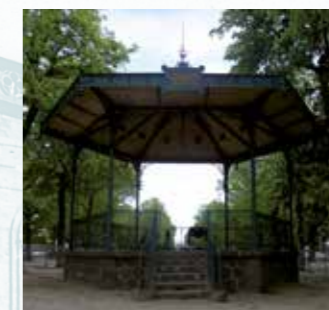
Le kiosque à musique fut offert, en 1909, à la ville de Saint-Flour par le regretté Alfred Ravoux, conseiller municipal et mélomane.

Nous voici maintenant à l'extérieur de la vieille ville, sur le cours Spy-des-Ternes, du nom du maire de Saint-Flour, qui nous a légué le bel agencement des “ Promenades ” (orgueil des Sanflorains), aujourd'hui Allées Georges Pompidou . C'est au début du XX e siècle que les ormes furent remplacés par des marronniers et qu'un kiosque à musique fut élevé. A l'entrée de l'enceinte de l'ancien Petit Séminaire, fut érigé, en 1975, un mémorial en l'honneur du Président de la République, Georges Pompidou, enfant du pays.