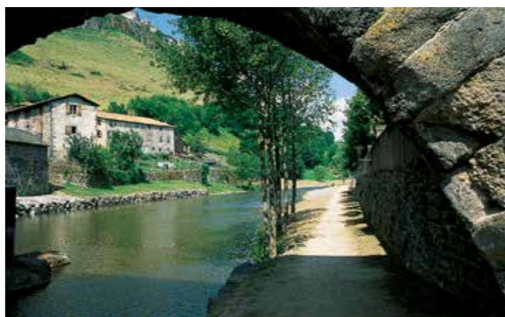
Le Pont Vieux fut reconstruit partiellement en 1404 avec des pierres provenant des maisons des “faux bourgs” détruites par les bandes anglo-gasconnes. Pour exécuter ce travail, il fallut détourner le cours de l' Ander .

à recevoir le tan. Les maisons de tanneurs sont encore reconnaissables à leurs grandes baies derrière lesquelles séchaient les peaux.