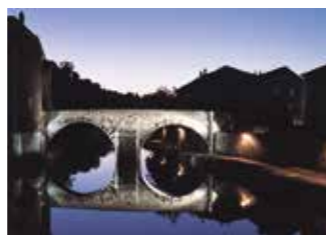
En venant du nord-est, le Pont Vieux à dos d'âne était le premier obstacle fortifié que rencontrait le voyageur du Moyen Âge sur la route de Lyon à Toulouse et sur celle du Puy à Rodez. Sur la rive gauche, une tour à cheval sur ce pont en défendait l'entrée.

Quelques pas plus loin, au pied des premiers degrés du “ Chemin des chèvres ”, le faubourg se dévoile, dominé par le clocher de l'église néogothique, Sainte-Christine (1854-1890). En avant de ce clocher, une tour ronde au toit en éteignoir, se situe au centre du quartier des Verdures , du nom des tapisseries dont les teintes dominantes étaient le vert de la nature et le bleu du ciel. D'ici, nous apercevons le Pont Vieux , seul à permettre au Moyen Âge, le franchissement de l' Ander . Sur la pile centrale, était construit un édifice dans lequel une personne, la “recluse”, consentait à se laisser enfermer pour protéger la Ville par ses prières. L'eau de l' Ander faisait fonctionner une dizaine de moulins pour la mouture du grain et le foulage du drap. Son affluent, le Résonnet , était bordé de tanneries qui utilisaient son eau pour préparer les peaux