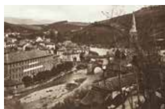
L'absence d'unité topographique et urbaine et la quasi-inexistence de fortifications dans le faubourg représentaient, au Moyen Âge, une faiblesse importante pour la défense de la Ville. Le faubourg a souvent été dévasté par les incursions anglaises (première prise en 1353).

A la croisée des montées , enchâssée dans le mur, remarquons la niche