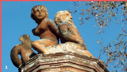
1. Détail du pavillon de lecture du parc Foucaud

Depuis 2014, elle met en place un Site patrimonial remarquable afin de disposer d'un outil de protection performant et adapté de son centre ancien et de ses faubourgs. Afin de transmettre son histoire et ses patrimoines auprès du plus grand nombre, elle est engagée depuis 2018 et aux côtés de l'Etat dans la mise en œuvre d'une convention Ville d'art et d'histoire.