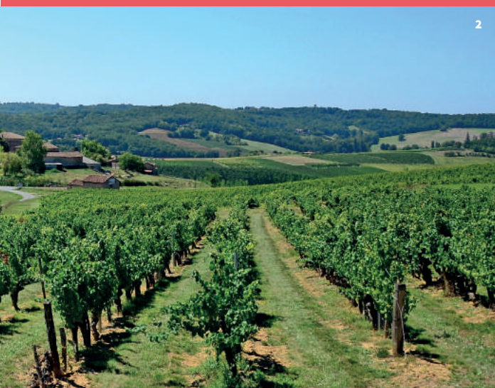
2. Vue des coteaux viticoles