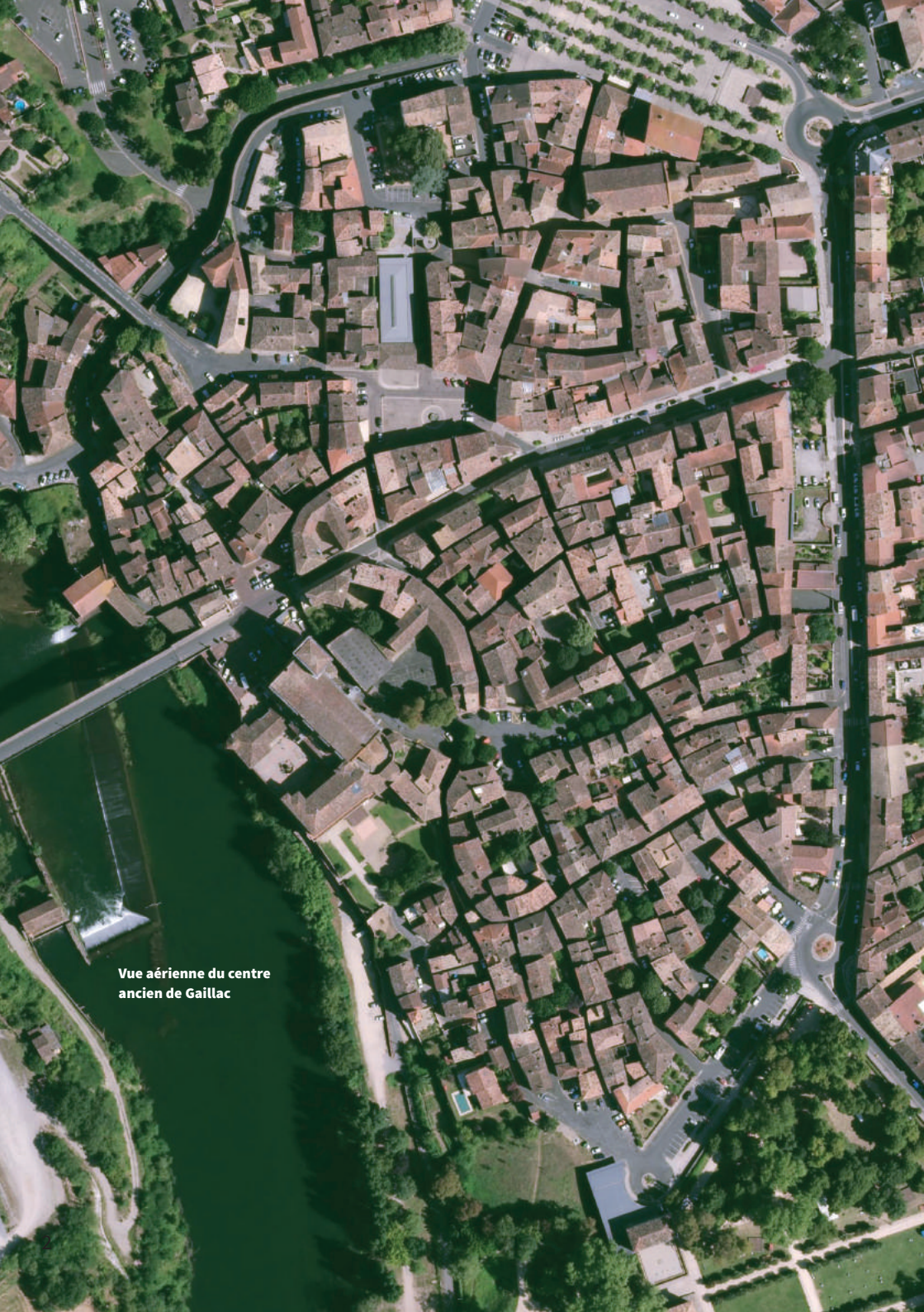
Vue aérienne du centre ancien de Gaillac