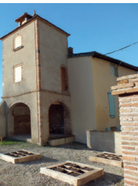
1. Abbaye Saint-Michel