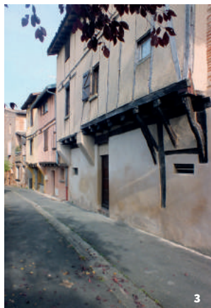
3. Vue du quartier de la Portanelle