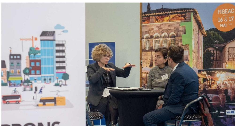
Espace Partenaires lors du congrès de Sites & Cités remarquables de France

Créée en 2018, la Banque des Territoires est un des cinq métiers de la Caisse des Dépôts. Elle rassemble dans une même structure les expertises internes à destination des territoires. Porte d'entrée client unique, elle propose des solutions sur mesure de conseil et de financement en prêts et en investissement pour répondre aux besoins des collectivités locales, des organismes de logement social, des entreprises publiques locales et des professions juridiques. Depuis 2007, la Caisse des Dépôts et Consignations accompagne Sites & Cités sur les quartiers anciens et la performance énergétique du bâti ancien.