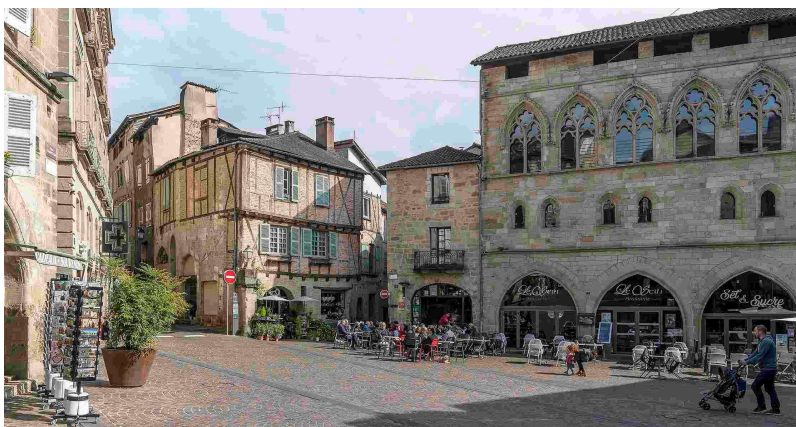
Place Champollion, centre historique de Figeac

Les cinq cents congressistes ont apprécié les visites de Figeac et du Grand Figeac, cité à la qualité de vie exceptionnelle, riche de son histoire et ancrée dans le dynamisme du monde contemporain.